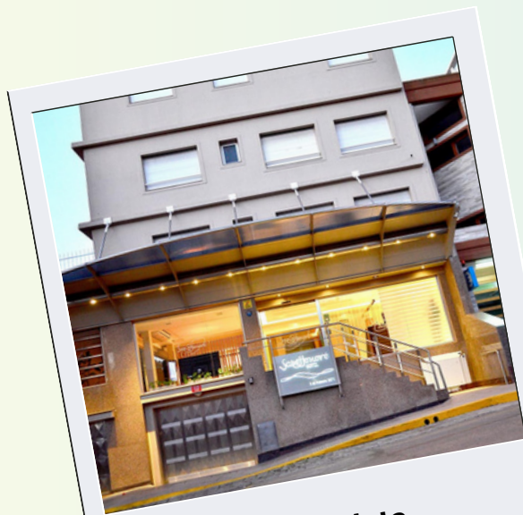
Mar del Plata