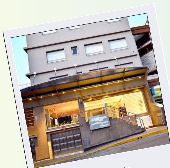
Mar del Plata