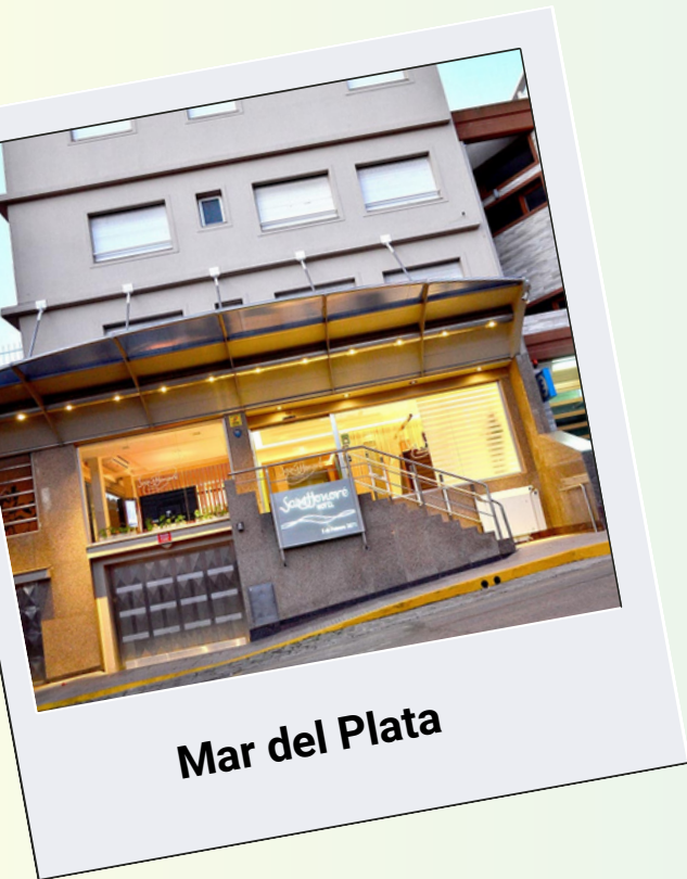
Mar del Plata