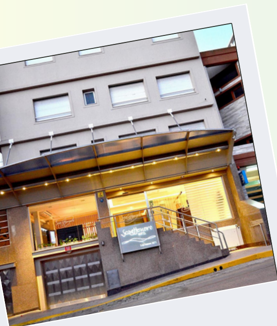
Mar del Plata

Otros servicios: Salón desayunador, sala de juegos para niños, WiFi y estacionamiento cubierto.